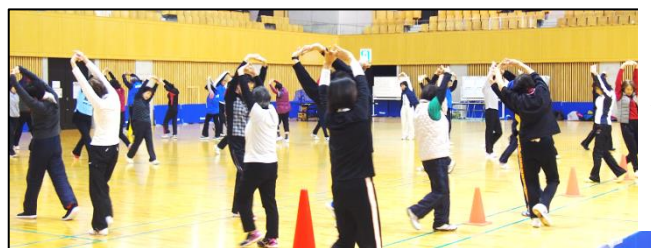
カーニバル 昨年度の県スポーツ

山口県生涯スポーツ推進センター (広域スポーツセンター) TEL: 083-933-4697 (山口県体育協会) FAX: 083-933-4699