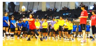
長門スポーツカーニバル(トップアスリートによるハレー教室)

このような願いや思いを叶えるために、 1 事業約 12 万円の助成を活用してみませんか？