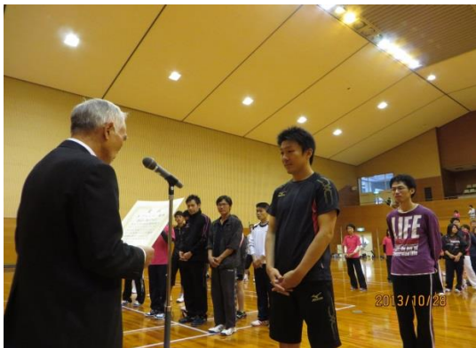
・ソフトバレーボール試合及び表彰の様子（上） ・バドミントン体験教室の指導者「ACT SAIKYO」の皆さん（右）